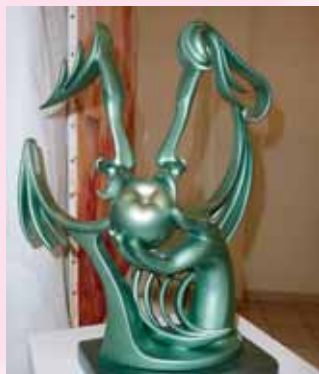
Prix Municipalité Serge Lavenant