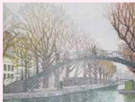
Prix Municipalité Gérard Leger