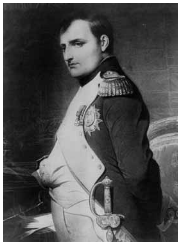
Napoléon Bonaparte par Paul Delaroche