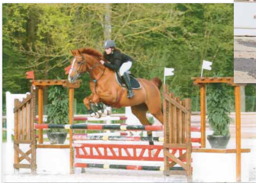
Saut d'obstacles en avril 2008 au Centre Hippique de Marolles en brie.