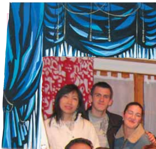
Illustration Patrick BONNAT