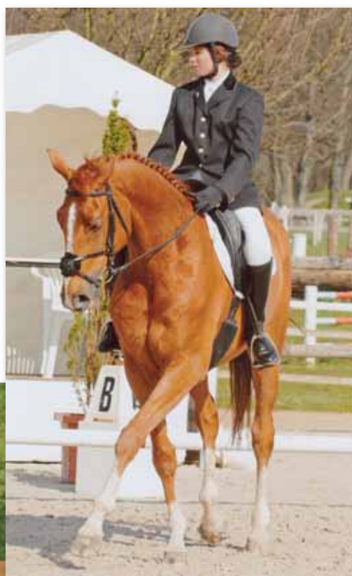
Dressage en février 2008 au Haras de Jardy à Marnes-la-Coquette.