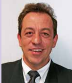
Monsieur le Maire