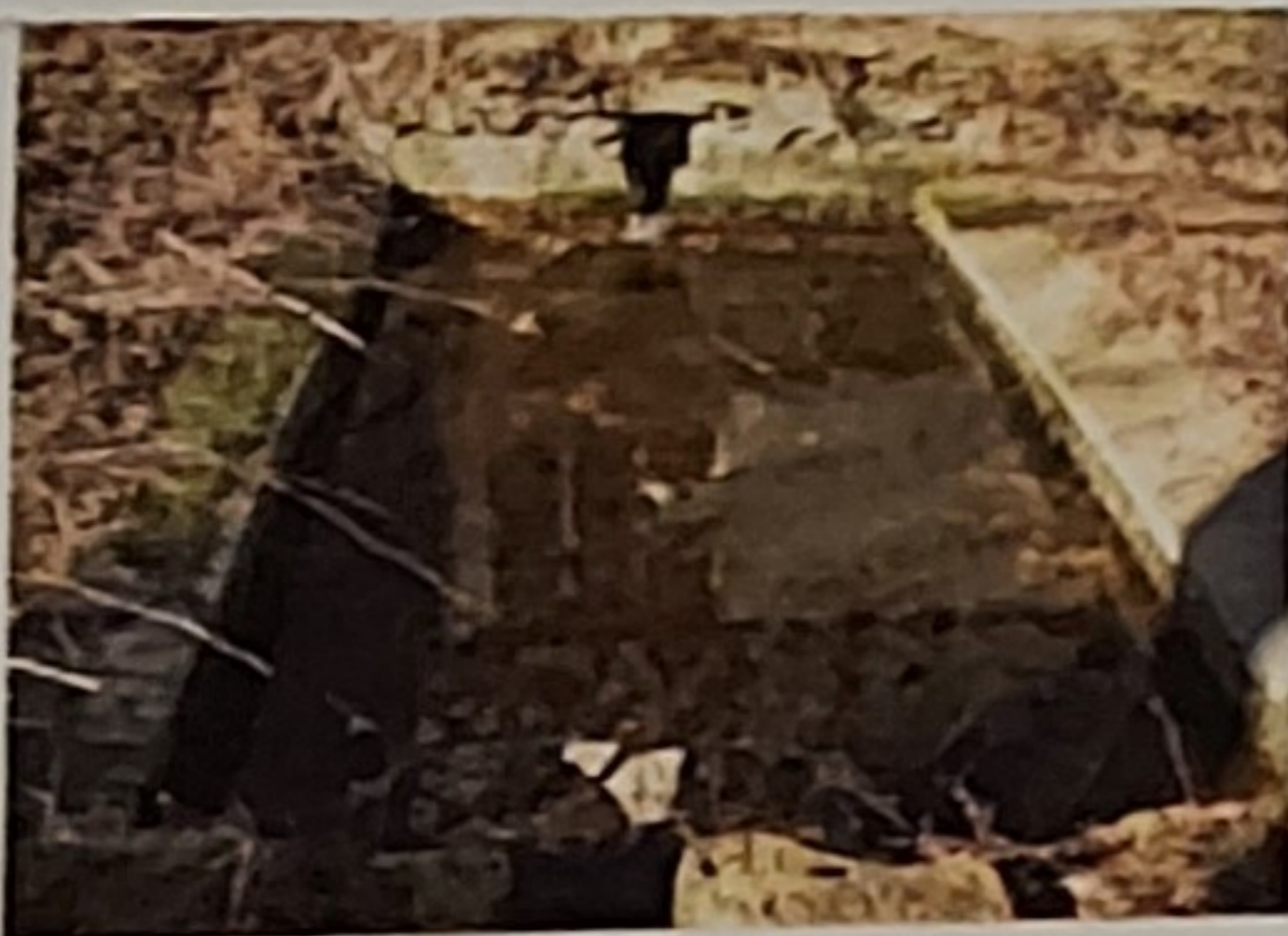
Source au Brie