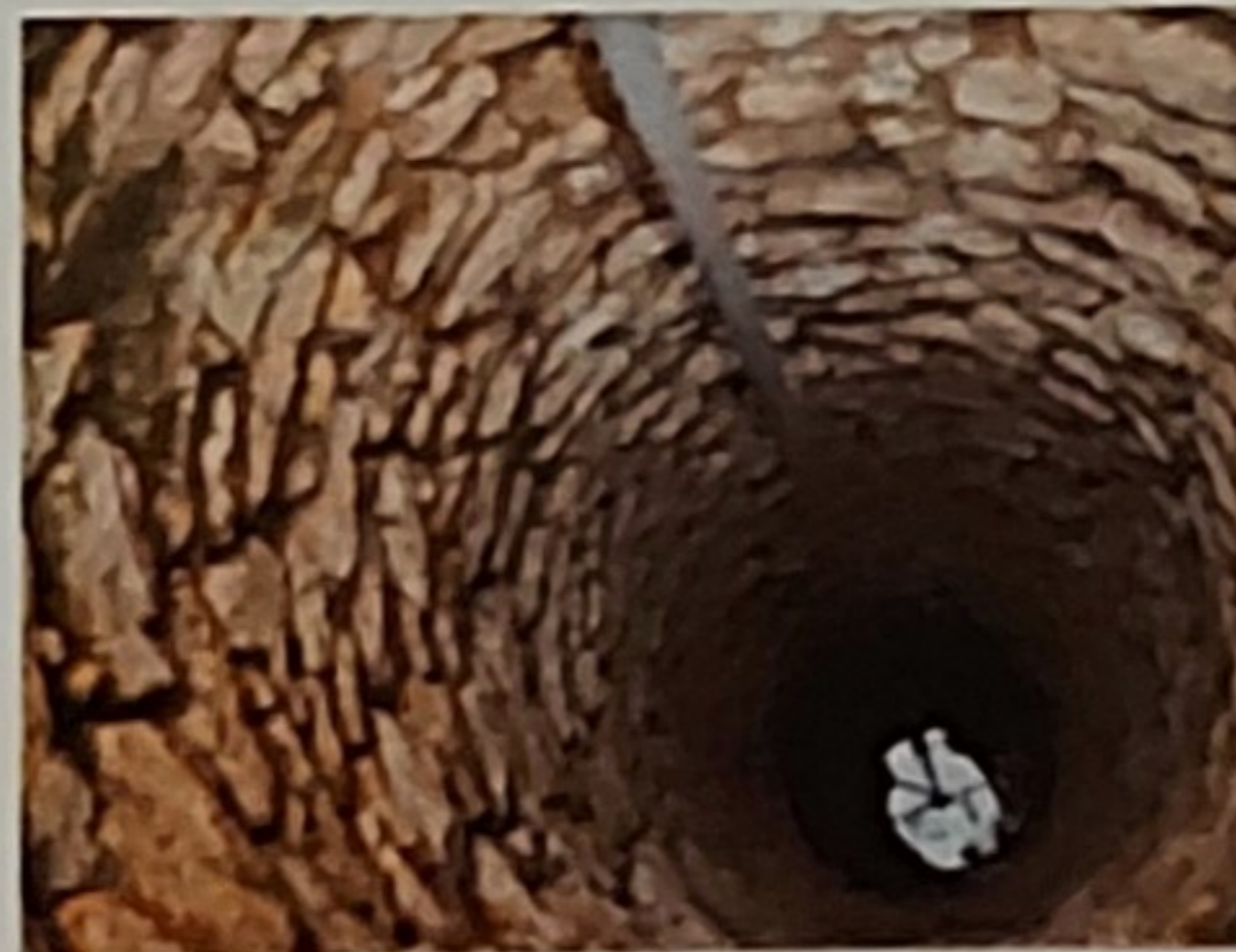
Puits au Brie

AQUI' Brie, association loi 1901, mène depuis 2001 des actions pour comprendre et préserver la nappe phréatique des calcaires du Champigny. Cette nappe profonde d'eau souterraine, située sous la nappe du Brie, approvisionne en eau potable près d'1 million de franciliens et permet l'irrigation des cultures. AQUI' Brie cherche à mieux faire connaître ces nappes, à évaluer leur fragilité face au changement climatique pour s'y adapter. Nous accompagnons tous les acteurs professionnels vers la réduction des pesticides, et oeuvrons à la restauration des zones humides.