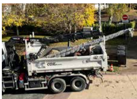
Début installation vidéo surveillance