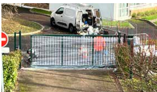
Changement du portail école coté grande rue