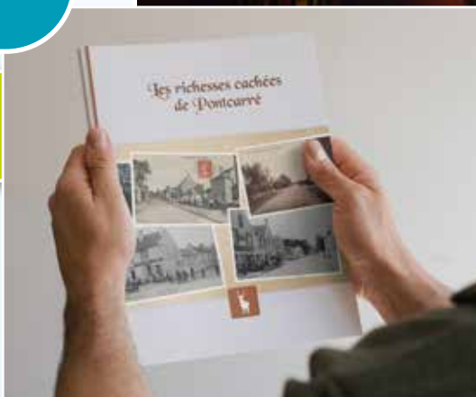
Livre édité par la municipalité